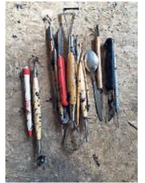
Yvonne Piller Geboren: Heusden Woonst: Overveen Website: beeldtuinsantpoort.nl

'Niet van een foto, het moet anatomisch kloppen'