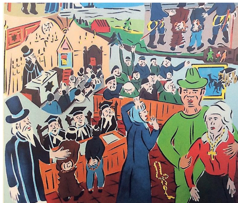
Een uitsnede uit een druksel van de kunstenaar.

Het werk van Kalkman is te bezichtigen bij de KCV-jubileumexpositie in het Raadhuis voor de Kunst in Velsen-Zuid..